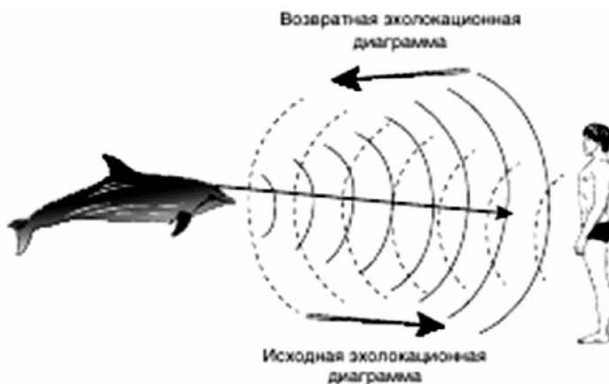
Рис. 2. Принцип эхолокации

знаваем. Эволюционно, однако, он становится все более целенаправленным и пользующимся развитыми специализированными структурами. У человека этот процесс качественно иной. Он социализирован и отличается комплексностью и функциональной плановостью.