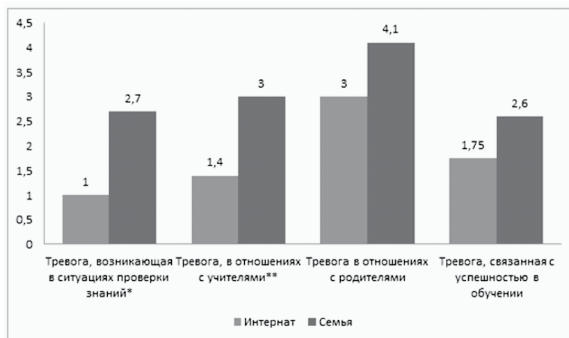
Рис. 2. Различия в показателях многомерной оценки детской тревожности между детьми с умственной отсталостью воспитывающимися в семьях и находящимися в условиях интерната Примечание: * - при p \leq 0,01 , ** - при 0,01 \leq p \leq 0,05

интернате (1,3). Данное различие может объясняться тем, что дети из интерната постоянно находятся в контакте со сверстниками, так как проживают с ними на одной территории. В то время как дети из семей в меньшей степени коммуницируют со сверстниками, их круг ограничен, присутствует объективная зависимость от родителей. Тревога в этом случае объясняется несформированными коммуникативными навыками, необходимыми для успешного взаимодействия со сверстниками. Такие дети, вступая в контакт, не умеют начать диалог, поддержать его, подобного рода затруднения могут приводить к отказу от дальнейшего взаимодействия со сверстниками и снижают их социальную активность.