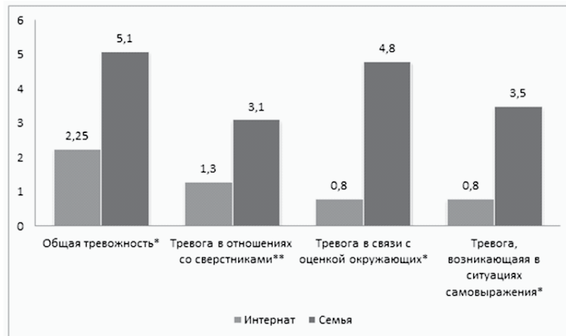
Рис. 1. Различия в показателях многомерной оценки детской тревожности между детьми с умственной отсталостью воспитывающимися в семьях и находящимися в условиях интерната Примечание: * - при p \leq 0,01 , ** - при 0,01 \leq p \leq 0,05