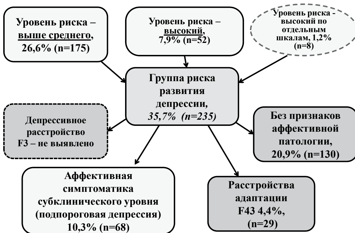
Рис. 3. Результаты исследования подростков различных групп на выявление аффективных симптомов различного уровня (n=659).

При этом должен учитываться социокультурный аспект функционирования подростка, который обеспечивается организацией помощи в условиях образовательного учреждения. Это положение находит подтверждение и при анализе современных исследований, показывающих, что психологическая терапия имеет сравнимый эффект с применением антидепрессантов в отношении симптомов депрессии, отказа от учебы и длительности ремиссии [10].