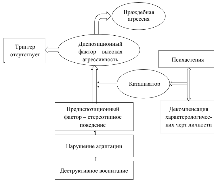
Рис. 1. Механизм агрессии по враждебно-личностному типу