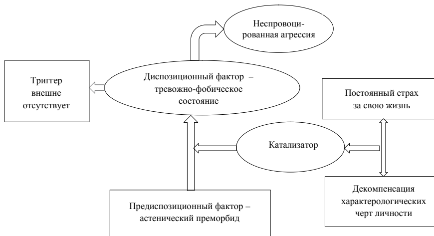
Рис. 2. Механизм агрессии по отставленному аффектогенному типу

весниц. Психиатрической экспертизы не проходила. При обследовании в ИУ обнаруживалась повышенная утомляемость в процессе беседы, с периодическими вспышками раздражительности. На вопросы отвечала с чувством превосходства, жалоб не предъявляла. При более доверительных отношениях с обследующим лицом сообщила о частых головных болях, головокружениях, нарушениях менструального цикла, перенесенных ЧМТ без признаков сотрясения головного мозга. Неврологическое исследование дало заключение о наличии отдельных невыраженных резидуальных признаков органического поражения головного мозга без очаговой симптоматики. Психометрические исследования показали высокий уровень агрессивности,