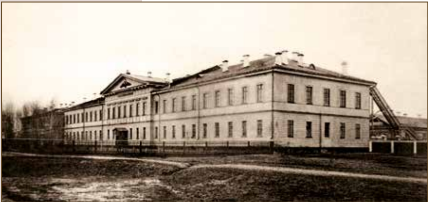
Казанский военный госпиталь

Для наглядности преподавания учения о структуре мозга В.М. Бехтерев в Казани создал цветную трехмерную модель мозга, включавшую в себя изученные к тому времени центры и проводящие пути. Этот макет был изготовлен Императорским Казанским университетом в 1890 году в двух экземплярах. В настоящее время один хра-