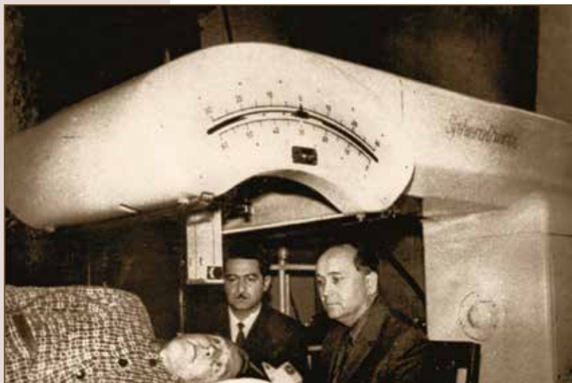
Исследование возможностей применения лучевой терапии пациентов с синдромом вербального галлюциноза, 1970–1971 гг.