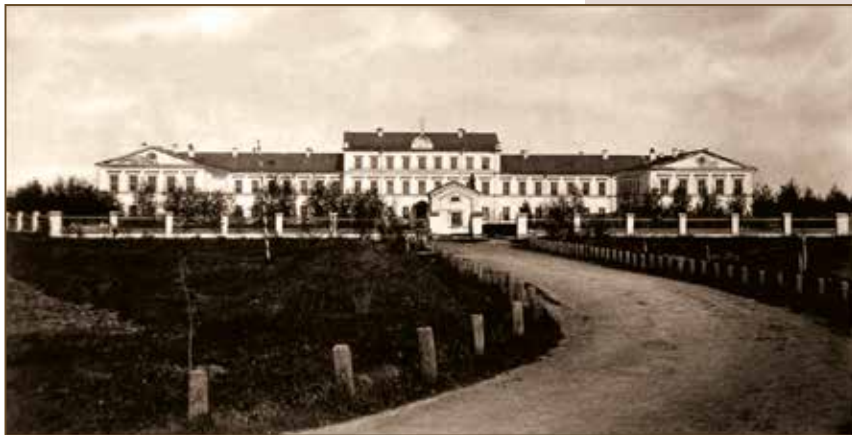
Казанская окружная лечебница

хиатрических лечебниц. Важная роль отводилась исследованиям в области судебной психиатрии, организации проведения судебно-психиатрической экспертизы и критериям определения вменяемости.