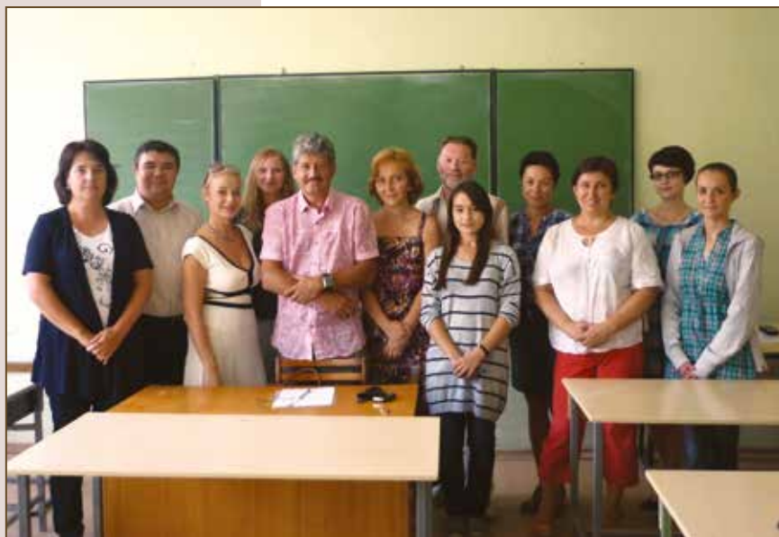
Сотрудники кафедры общей и медицинской психологии