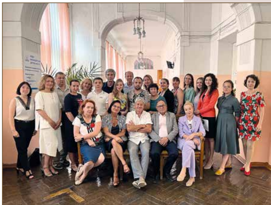
Коллектив кафедры психиатрии и медицинской психологии. 2022 год