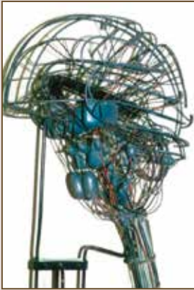
Модель проводящих путей головного мозга

обучение десятки студентов, ординаторов, врачей Казанской окружной лечебницы. В ее стенах сформировалась казанская школа В.М. Бехтерева. В ней он успешно реализовал принцип объединения экспериментальных исследований нервной системы специалистами разных областей науки. Для клинических исследований и преподавания психиатрии студентам с демонстрацией больных В.М. Бехтерев добился устройства университетской госпитальной клиники на базе Казанской окружной лечебницы.