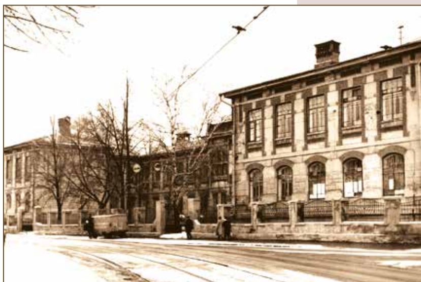
Психиатрическая клиника КГМИ

Еще одним направлением в научных исследованиях В.С. Чудновского, возникшим и развившимся в Казани благодаря фармакологической школе профессора-фармаколога И.В. Заиконниковой. В.С. Чудновский обратил внимание на то, что синтезирующие казанскими хи-