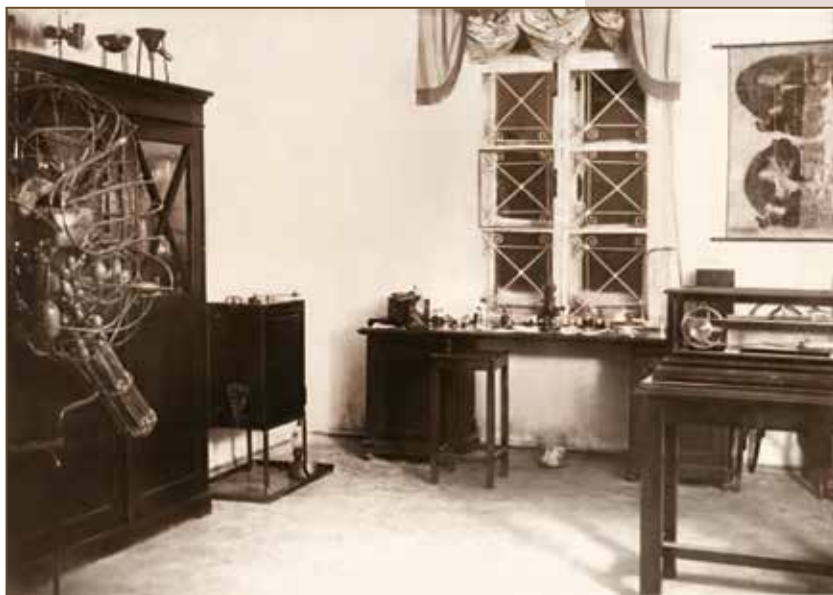
Казанская психофизиологическая лаборатория