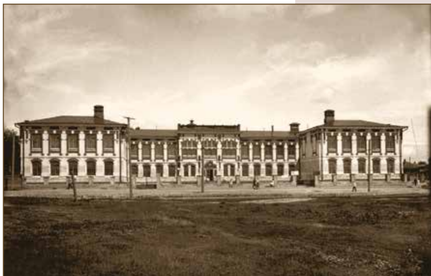
Психиатрическая клиника Казанского университета