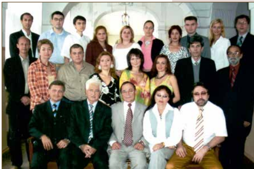
Коллектив кафедры психиатрии, 2005 год