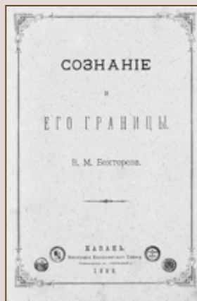
Актовая речь В.М. Бехтерева в Императорском Казанском университете

В.М. Бехтерев разработал и внедрил в психиатрическую практику новый оригинальный метод психотерапии, используя его при невротических расстройствах и алкоголизме. Вершиной научного творчества профессора В.М. Бехтерева в Казани