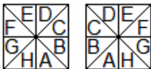
Рис. Секторы РОП

Цель и задачи: операционализация и проверка сформулированных гипотез, в частности сопоставительное исследование показателей хронотопа РОП, стресса, ПФД, клинических характеристик симптоматических ремиссий (СР; F33.4) и эффективности антидепрессивной психотерапии у пациенток после лёгкого или умеренной тяжести эпизода НРДР.