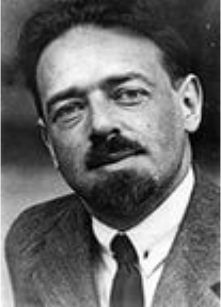
Бернштейн Николай Александрович (1886 – 1966)