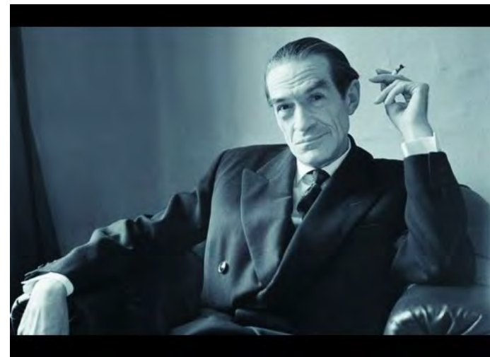
Леонтьев Алексей Николаевич (1903 – 1979)

Осознанная саморегуляция – системно организованный психический процесс по инициации, построению, поддержанию и управлению всеми видами и формами внешней и внутренней активности, которая направлена на достижение принимаемых субъектом целей.