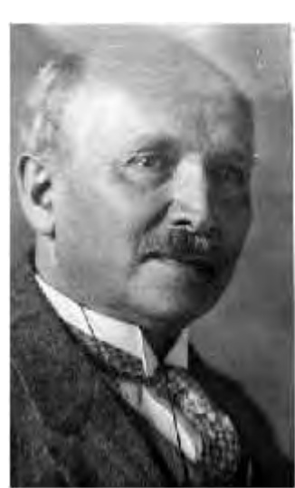
Albert Moll (1862 – 1939)

«Слов нет – когда распознавание делается с полной положительностью и без оговорок, то оно звучит лучше и производит более внушительное впечатление. Врачу, однако, нет никакой необходимости обременять свою совесть нравственной ответственностью и, для удобства судов или присутствий, высказываться более определенно, чем это ему позволяет убеждение... Мы, врачи, не можем с уверенностью говорить о наличии известного болезненного процесса и о неизбежных его последствиях, если у нас для этого нет вполне основательных, неопровержимых данных. Мы не только имеем право, но и обязаны говорить в таких случаях лишь о вероятности тех или иных патологических изменений, а отнюдь не утверждать, что они фактически имеются налицо».