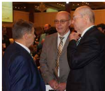
Обсуждение вопросов с коллегами

плодотворной работе на этом Съезде по общим вопросам и всем проблемам психиатрии. В ходе прошлого съезда была затронута масса актуальных вопросов, состоялось более 20 заседаний, посвященных различным аспектам состояния психиатрической помощи: терапии, реабилитации, наркологии, психотерапии, медицинской психологии, детской психиатрии и других наиболее значимым вопросам, необходимым для психиатрической науки и практики. Уверен, что Съезд 2015 года представит возможность в еще большей степени осветить все положительные изменения в отечественной психиатрии, а также позволит выработать наиболее эффективные способы разрешения еще не решенных, но острых проблем. Не менее важным являются образовательные мероприятия как с медицинским персоналом, так и с родными и близкими, позволяющие максимально способствовать скорейшему восстановлению психического здоровья больных. На сегодняшний день особенно актуально улучшение лекарственного обеспечения. Не сомневаюсь, что итоги Съезда дадут дополнительный импульс развитию психиатрии, а выработанные вами рекомендации будут способствовать развитию психиатрической науки и медицинской практики в нашей стране. В заключение хочу сказать всем вам огромное спасибо за ваш труд и ваше служение людям, за вашу верность профессиональному долгу. Желаю вам плодотворной работы и всего самого доброго!