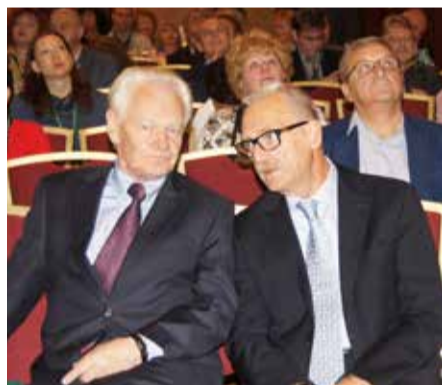
Идет работа Съезда