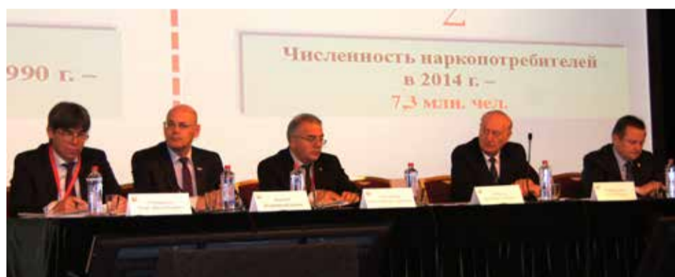
Президиум работы Съезда общественной организации «Российское общество психиатров»

Мероприятие было открыто выступлением Председателя Государственного антинаркотического комитета, директора ФСКН России В.П. Иванова: «В своем выступлении хочу поднять вопрос, точнее проблему, масштабную и наиболее острую – проблему наркомании. Почти 7,5 миллиона наших сограждан с разной степенью регулярности вводят себя в физическое состояние измененного сознания путем потребления психоактивных химических препаратов, а около 3 миллионов делают это ежедневно, по сути, пребывая в бинарном состоянии «эйфория-ломка». Это состояние не оставляет места ни социальной, ни экономической активности. Более того, их состояние повергает в ад, ужас и тяжелейшую жизненную ситуацию их родных и близких, а это уже 30-40 миллионов человек. Обсуждение этой проблемы на Съезде психиатров России представляется не просто актуальным, но и жизненно необходимым. Смее утверждать, что без выработки стратегической позиции психиатрического сообщества национальную систему не построить. Стратегия государственной антинаркотической политики РФ до 2020 года, утвержденная Указом Президента России, определяет два ключевых направления. Первое направление – это сокращение предложения наркотиков путем целенаправленного пресечения их контрабанды, нелегального производства и оборота внутри страны.