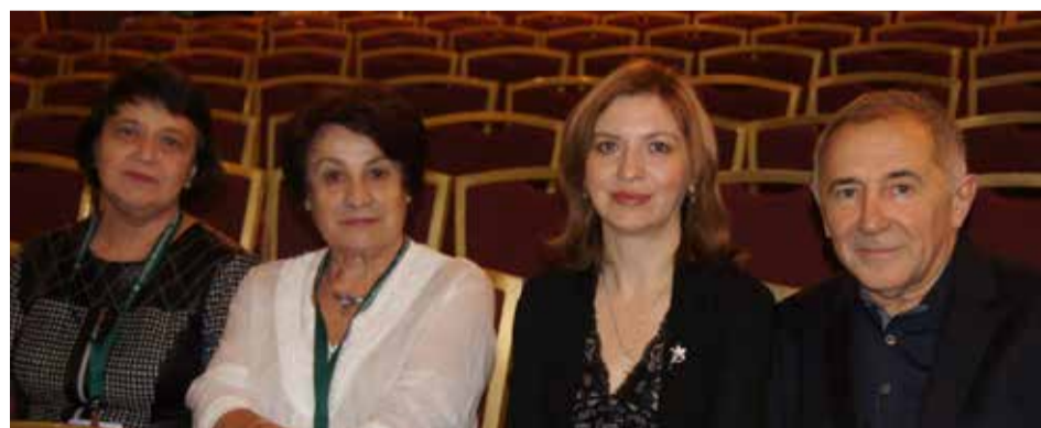
Делегация психиатров из Красноярска перед началом работы Съезда. «Мы – первые в зале!»