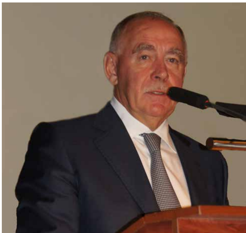
Иванов Виктор Петрович – директор Федеральной службы РФ по контролю за оборотом наркотиков