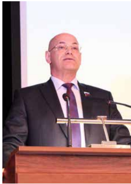
Владимир Игоревич Круглый – участник форума, сенатор, член Совета Федерации

« Доклад, с которым я выступила на заседании Съезда общественной организации «Российское общество психиатров», был посвящен перспективам повышения качества психиатрической помощи в Российской Федерации. В России за 2005–2014 годы