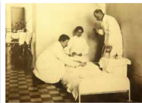
Обход больных в стационаре