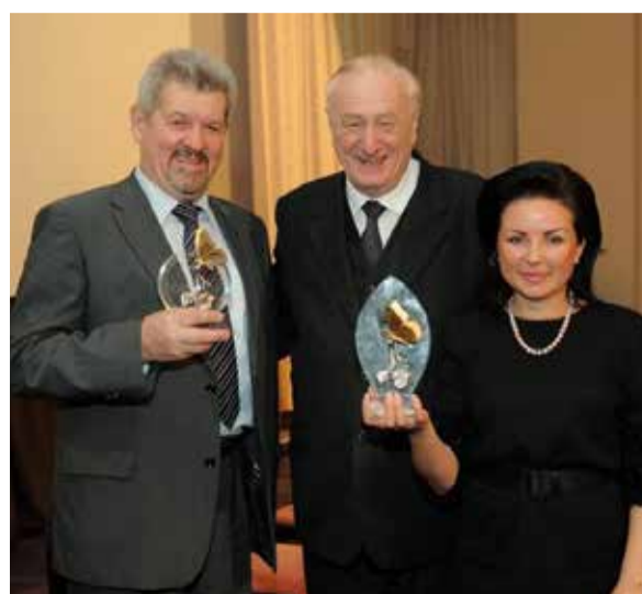
2012 год. – Номинация «Лучшее учреждение», статуэтка «Малая золотая бабочка»