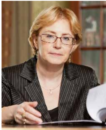
Скворцова Вероника Игоревна — министр здравоохранения Российской Федерации

« Уважаемые участники XVI Съезда психиатров России и всероссийской конференции с международным участием «Психиатрия на этапах реформ: проблемы и перспективы»!