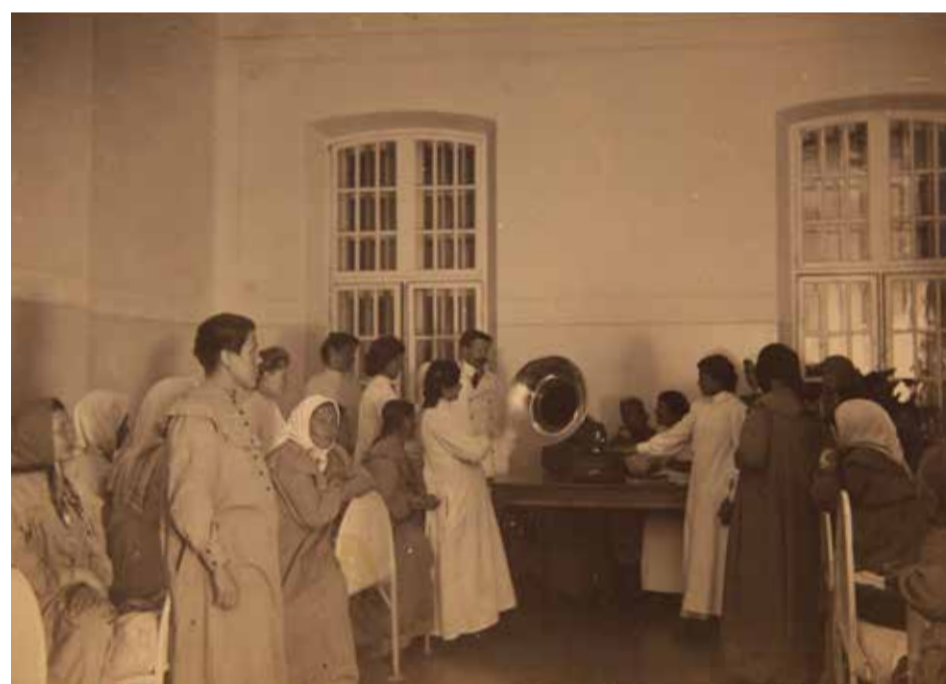
Развлечение пациентов. Больные слушают граммофон в отделении

С 2010 г. больницу возглавляет заслуженный врач Республики Татарстан — опытный организатор здравоохранения Фарит Галимзянович Зиганшин. С его приходом значительно изменился стиль работы учреждения, что проявилось в отчетливом стремлении к инновационному развитию, использованию новаторских подходов к организации лечебно-диагностического процесса. Газета Съезда