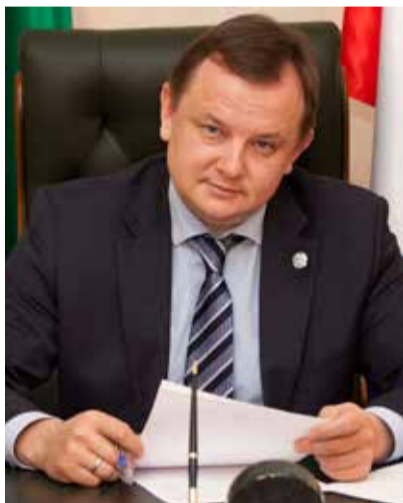
Вафин Адель Юнусович — министр здравоохранения Республики Татарстан