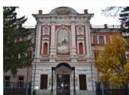
Здание ГАУЗ «Республиканская клиническая психиатрическая больница им.акад.В.М.Бехтерева» МЗ РТ

Дальнейшее развитие в головном учреждении и ее филиалах получили прогрессивные полустационарные организационные формы. Их наличие позволяет оказывать психиатрическую помощь как первичному контингенту, так и на этапе «долечивания» пациентов после стационара в наименее ограничительных условиях.