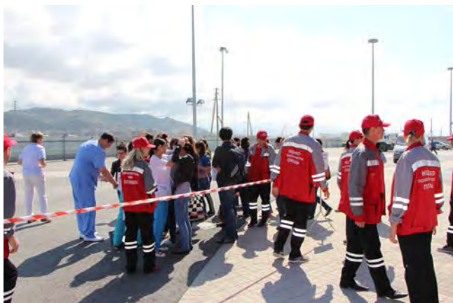
Сотрудники больницы на тактико-специальных учениях в районе олимпийских объектов г.Сочи

Кроме общепсихиатрических и стационарных экспертных отделений в структуру клиники входят диспансерное отделение, два отделения амбулаторной судебно-психиатрической экспертизы; рентгенологическое отделение; отделение и функциональной диагностики; отделение реанимации и интенсивной терапии с кабинетом трансфузиологии и барозалом; отделение физиотерапии с кабинетом лечебной физкультуры; патопсихологическая и клинико-