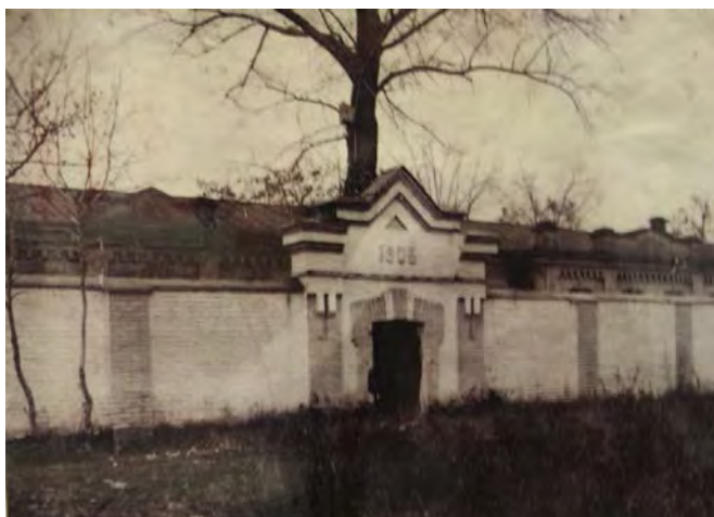
Психиатрическое отделение Екатеринодарской войсковой казачьей больницы – 1903 год

В отчётах начальника Кубанской области и Наказного атамана Кубанского казачьего войска в разделе «Народное здоровье. Организация врачебной помощи» есть сведения о том, что в феврале 1902 года при Екатеринодарской войсковой казачьей больнице открыто отделение для психических больных на 23 койко-места. Однако годом основания стационарной психиатрической службы края принято считать 1903 год, когда в это отделение поступили первые пациенты и оно начало