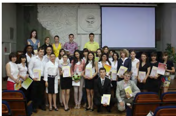
Студенты и интерны кафедры психиатрии ГБОУ ВПО КубГМУ Минздравсоцразвития России – лауреаты краевого конкурса молодых ученых

Великобритании, Израиля, Швейцарии, Франции, Москвы и Санкт-Петербурга проводят супервизии работы врачей в парадигме современного психоанализа.